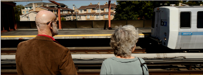
Vivir de manera independiente favorece un estilo de vida más saludable. Los hogares que se encuentran a una corta distancia a pie del BART brindan acceso a la región.