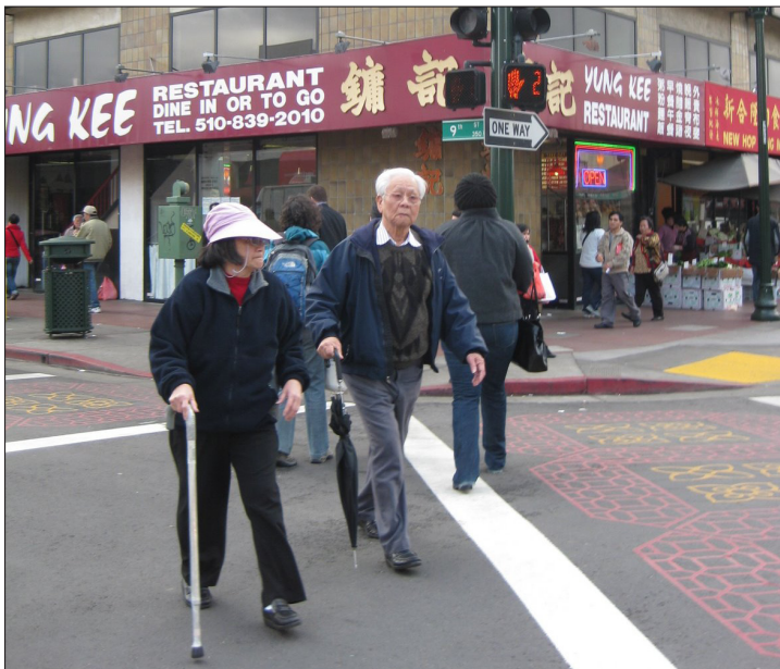
A las personas de tercera edad en el Barrio Chino de Oakland les encanta el sistema de cruce peatonal que les permite movilizarse en cualquier dirección durante la señal para peatones. Este innovador diseño de cruce peatonal ahorra tiempo y esfuerzo para llegar a sus destinos.

CRUCES PEATONALES SEGUROS Tiempos más prolongados de cruce para las señales peatonales, señales sonoras que se oigan con claridad para personas con poca visión, distancias de cruce peatonal más cortas, alta visibilidad y cruces peatonales elevados son la clave para lograr cruces peatonales más seguros.